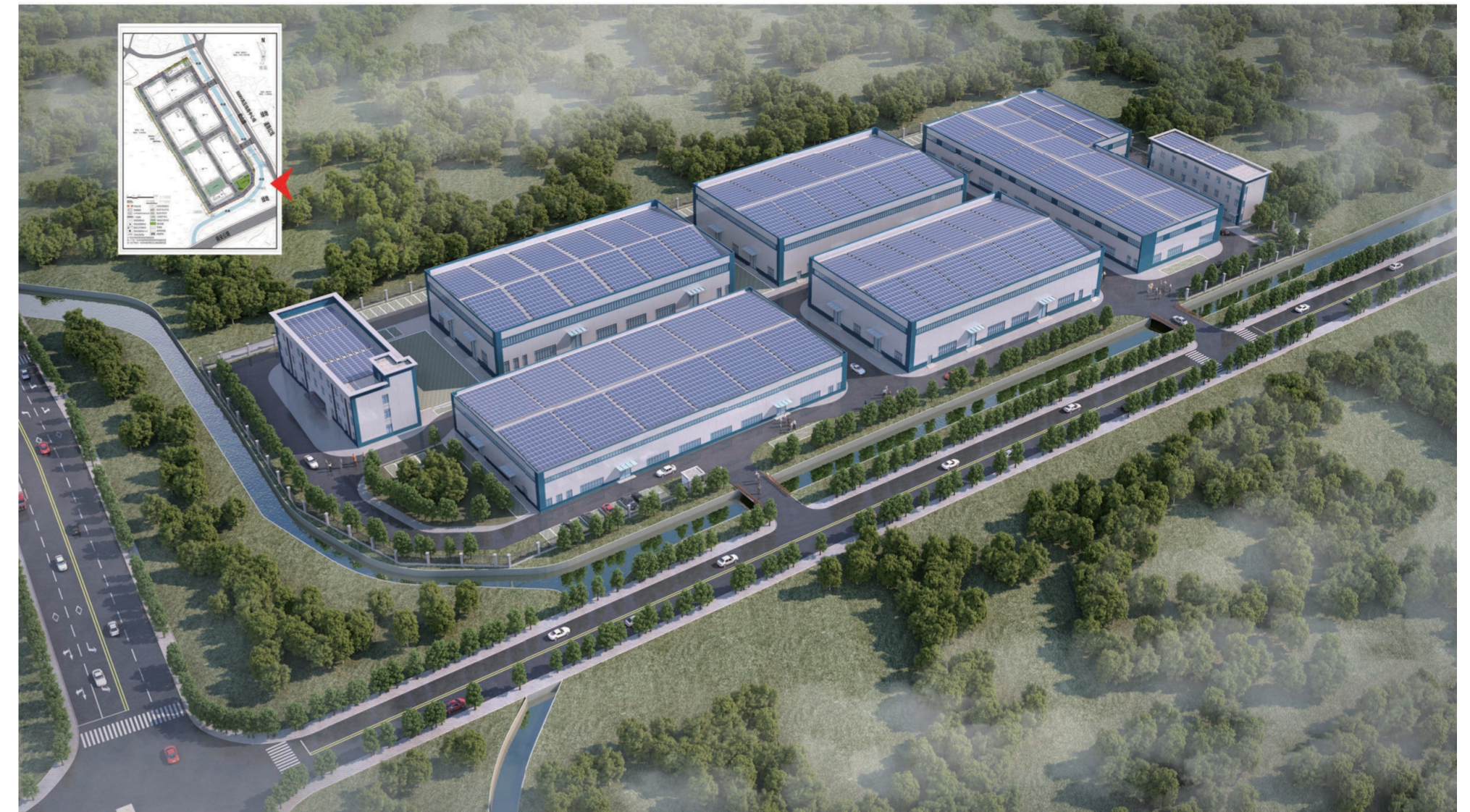
屋面光伏仅为示意, 实际效果以最终施工方案为准