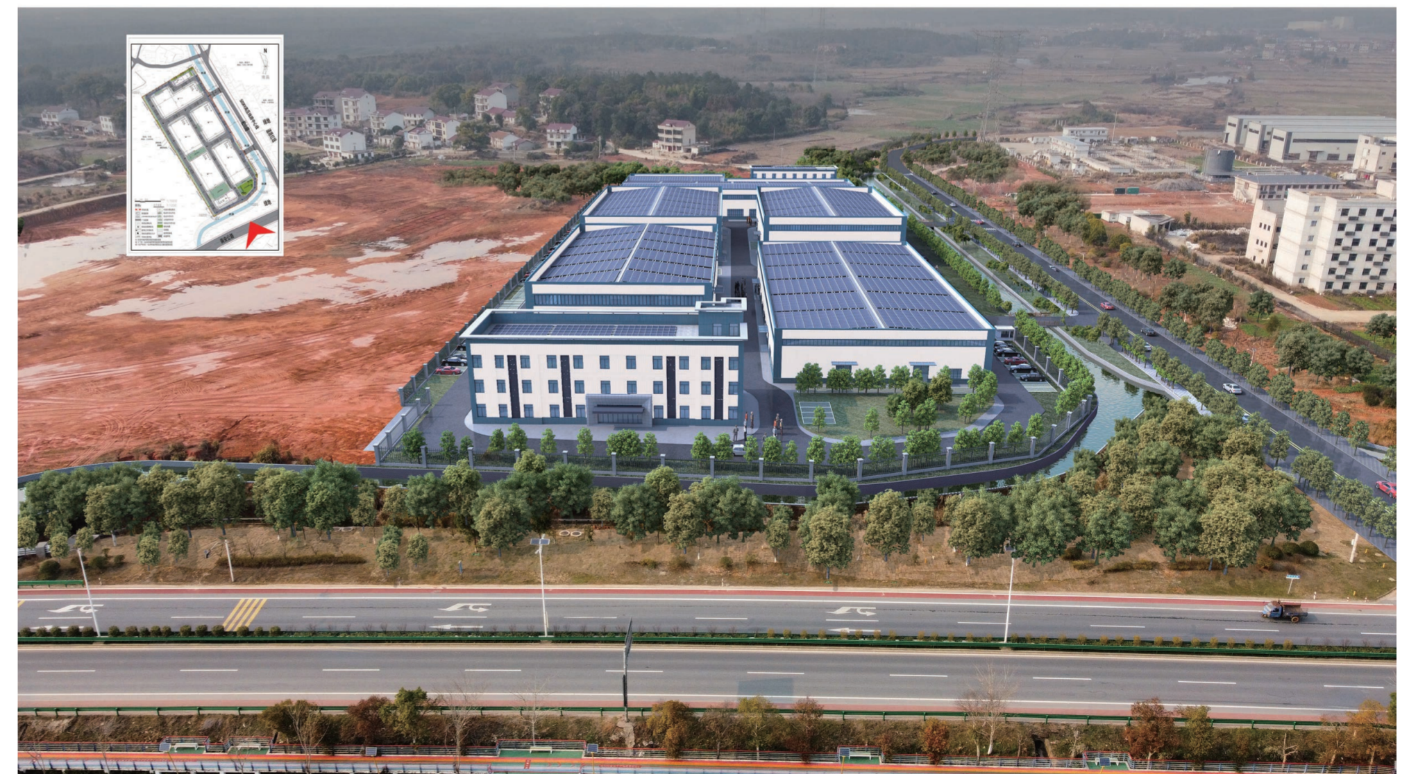
屋面光伏仅为示意, 实际效果以最终施工方案为准